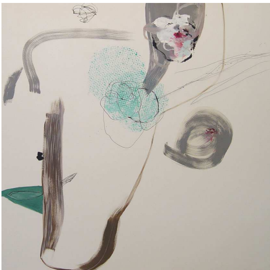
Autorretrato con pelo largo y lápiz. 81x61cm. t/m sobre lienzo. 2004