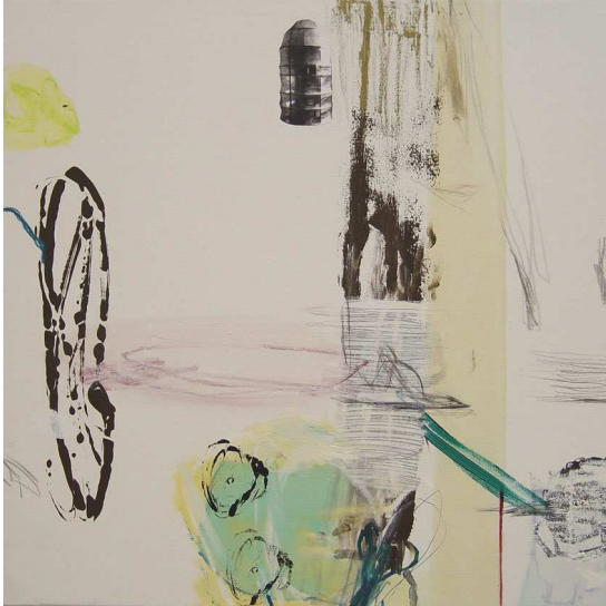
Escondida. 80x80cm. t/m sobre lienzo. 2003