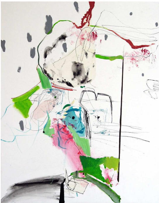
Mujer sin defensa. 100x81cm. t/m sobre lienzo. 2004