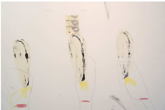
De ti. 180x120cm. t/m sobre lienzo. 2004