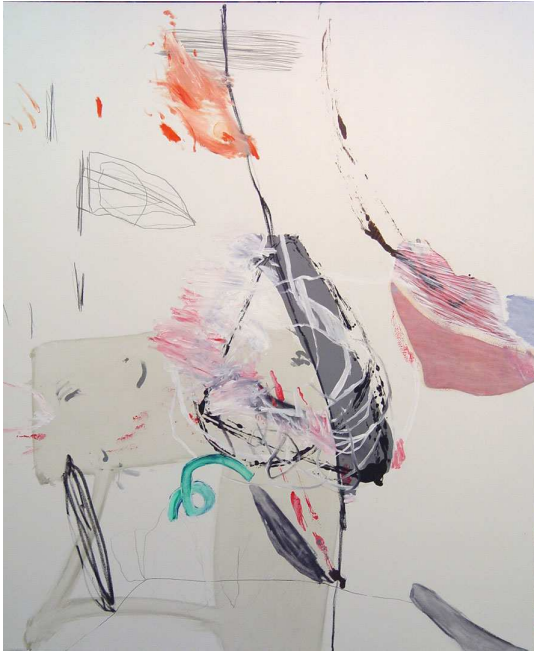
Hello? Bienvenido a la realidad. 190x162cm. t/m sobre lienzo. 2004