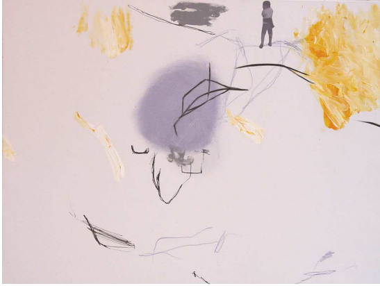
El principio. 81x61cm. t/m sobre lienzo. 2004