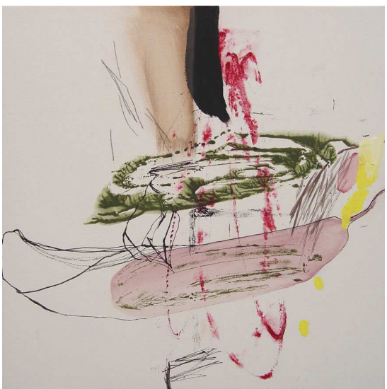
En Compañía. 61x61cm. t/m sobre lienzo. 2004